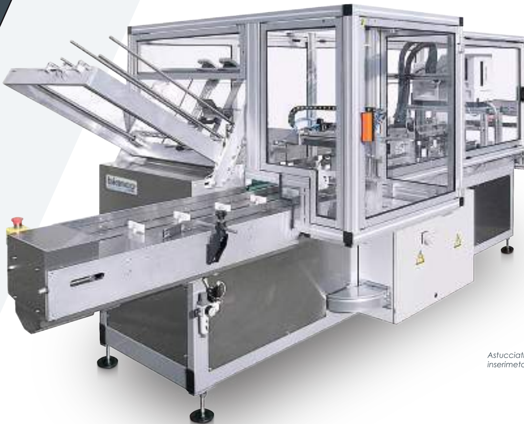
Astucciatrice MRA: inserimento prodotti

L'astucciatrice per scatole MRA esegue apertura, riempimento e chiusura di scatole in cartoncino preincollate. I tipi di scatole e chiusure eseguibili possono essere con linguette ad incastro, con lembi totali/parziali incollati/arrotondati, con soffiotti laterali, con divisori interni, scatole inclinate, etc. Optional: estensione magazzino, impilatore prodotti, inseritore fogli illustrativi, codificatore.